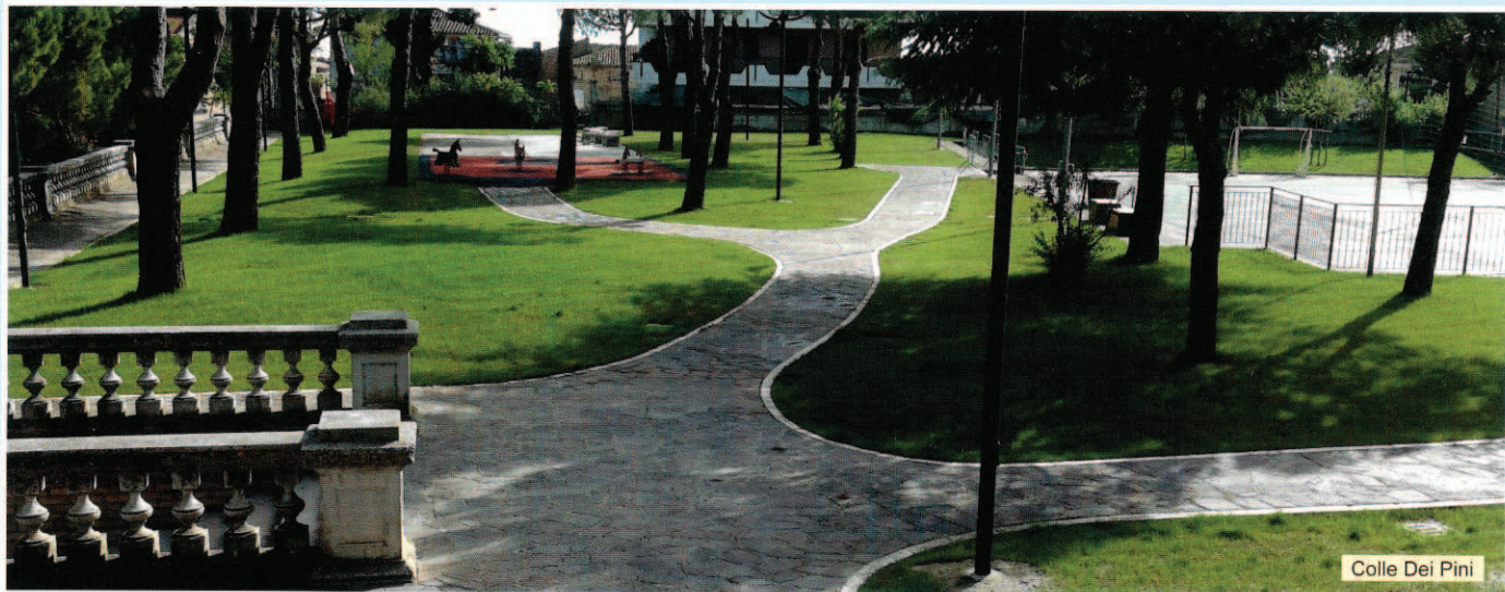
Colle Dei Pini